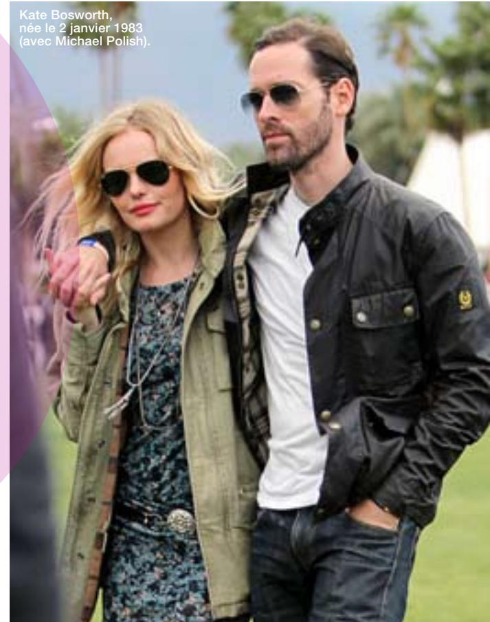
Kate Bosworth, née le 2 janvier 1983 (avec Michael Polish).

Votre modus amorandi pourrait ces temps-ci être qualifié d'"attachement distant". On vous aura rarement vue aussi fidèle à vous-même, affichant ouvertement votre nature profondément double. Dans votre bouche, un oui pourra dire non, et vice versa : la communication ambivalente sera votre spécialité. Pas facile à décrypter pour un amoureux d'un soir ou d'un été. Sauf que le cosmos vous demandera tôt ou tard de clarifier la situation et d'admettre qu'une certaine confusion règne. Car si vous vous sentez perplexe d'un côté, vous n'en serez que plus embourbée de l'autre. Et vous qui faites souvent l'apologie de la franchise, mettez donc vos principes en application ! Les obstacles disparaîtront peu à peu, vos projets avanceront à la vitesse grand V, y compris vos envies amoureuses. Corollaire agréable, l'argent coulera à flots, vos amis vous entoureront, et, surtout, la target que vous cibleriez sera ravie de se mettre à votre service.