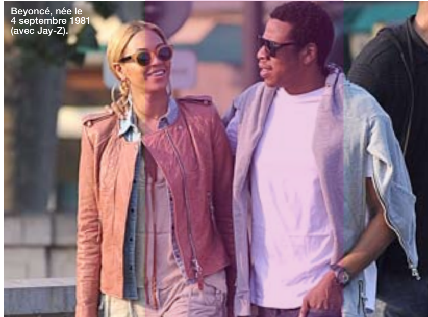
Beyoncé, née le 4 septembre 1981 (avec Jay-Z).