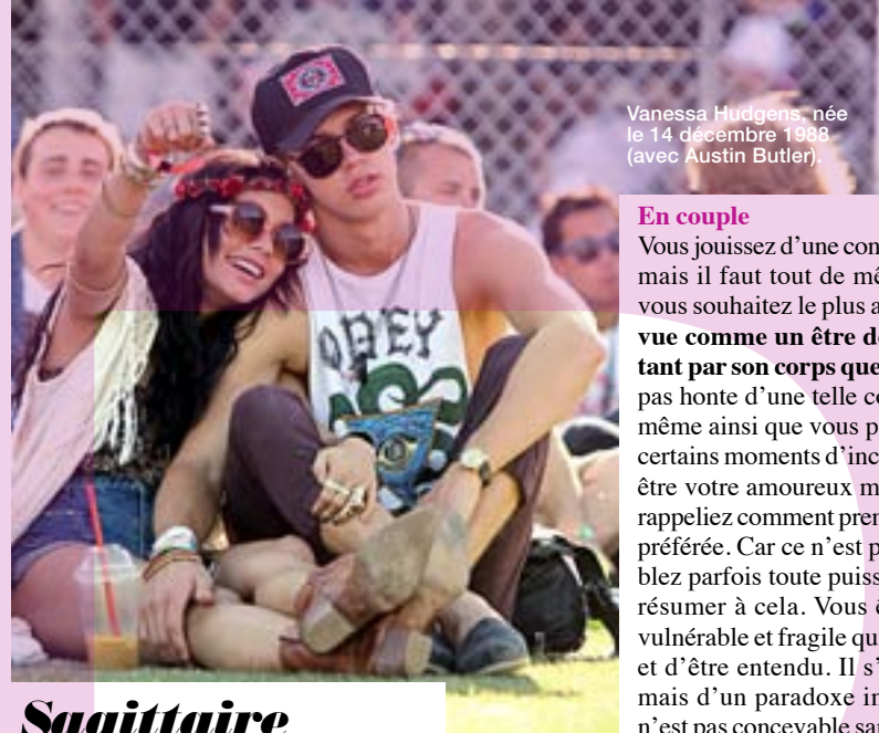
Vanessa Hudgens, née le 14 décembre 1988 (avec Austin Butler).

Ne vous laissez pas enfumer par les nuages qui tenteront d'obscurcir votre couple au milieu de l'été. Non seulement vous n'avez rien à craindre, mais surtout, vous avez tout à y gagner ! Vous vouliez une évolution : c'est peut-être bien cela qui se présente à vous aujourd'hui. Dans le meilleur des cas, vous oublierez le temps où vous cherchiez à "corriger" votre moitié. Vous vous concentrerez essentiellement sur vous, plongeant au fond de cette étrangère que vous êtes parfois pour vous-même. Vous apprendrez également que votre idylle ne s'est en rien essoufflée, qu'elle s'était simplement cachée sous des strates de vie quotidienne. Un bel hôtel, quelques jours au bord de la mer suffiront à la réactiver. Préparez-vous à beaucoup d'émotions renouvelées, ainsi qu'à de belles étreintes volées. Et en septembre, vous pourriez bien vouloir rendre votre engagement encore plus solide qu'il ne l'est déjà.