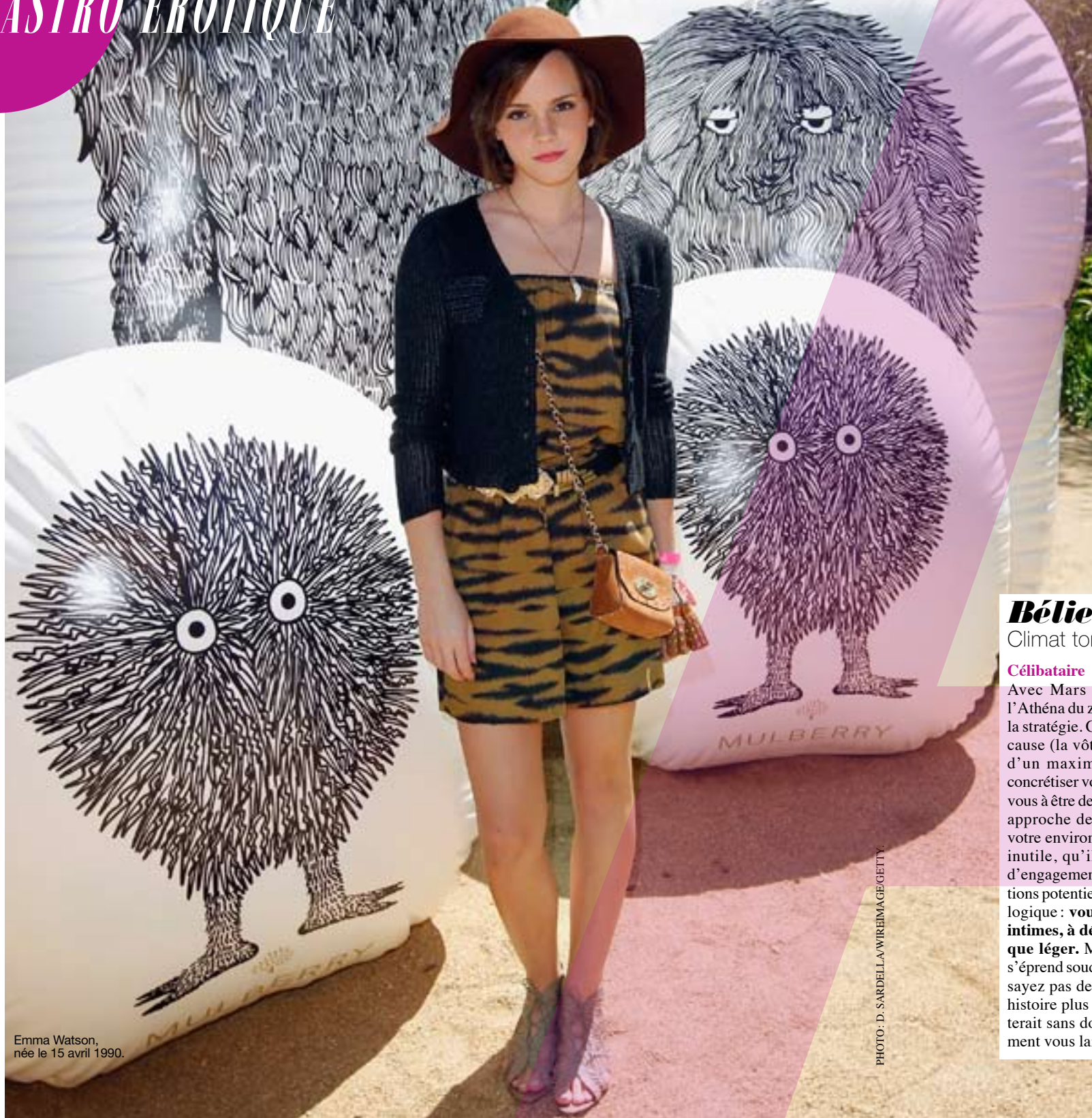
Emma Watson, née le 15 avril 1990.