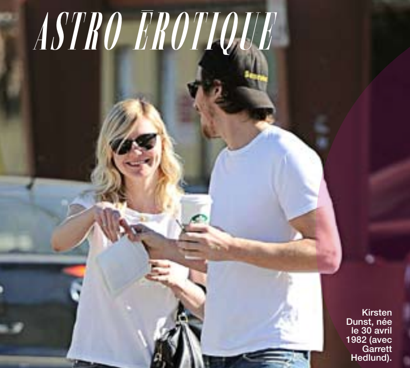
Kirsten Dunst, née le 30 avril 1982 (avec Garrett Hedlund).