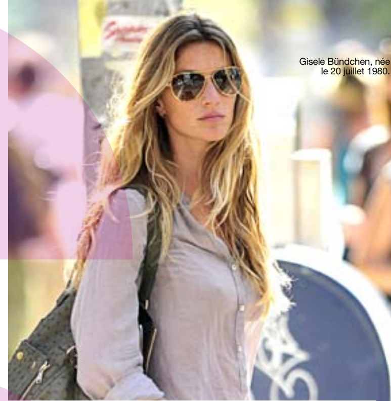
Gisele Bündchen, née le 20 juillet 1980.

Votre plus grande richesse réside dans votre bonne santé affective. Certes, les six mois un peu chahutés que vous venez de vivre vous ont mis les nerfs en pelote, mais il s'agit maintenant de trouver la paix intérieure, surtout dans votre vie personnelle. La voie à suivre ? Principalement, baisser votre garde. Laissez votre amoureux décider de ce que vous ferez cet été, vous vous consacrez d'autant mieux à vous-même, et à vous seulement. En investissant ainsi votre temps et votre énergie, vous vous verrez généreusement récompensée : un ancien projet créatif renaîtra soudain, un rituel de méditation ou de gymnastique prendra place dans votre quotidien, et vous vous sentirez davantage maître de vous-même. Ce nouvel équilibre intérieur ne pourra avoir que des résultats positifs sur votre relation, de jour comme de nuit.