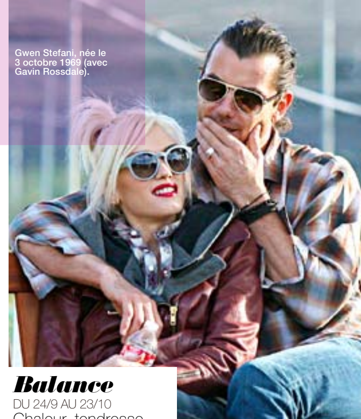
Gwen Stefani, née le 3 octobre 1969 (avec Gavin Rossdale).

Lentement mais sûrement, vous avez changé. D'une certaine façon, vous êtes même difficilement reconnaissable par ceux qui affirment vous connaître le mieux. Ce qui expliquera chez votre partenaire une tendance un peu soudaine à vouloir vous protéger : c'est qu'il tient à garder près de lui celle à laquelle il est habitué ! Cela paraît sensé : vous étiez jusqu'ici contente de jouer le rôle que les autres vous ont choisi – les choses étaient ainsi faciles à faire, et la situation, confortable. Mais tout ça, c'est du passé ! Vous voilà libre, décomplexée, assoiffée de plaisirs nouveaux, tant intellectuels que sensuels. Accordez une chance à votre amoureux de revenir à votre hauteur, de s'adapter à votre nouveau vous. Rassurez-le aussi : votre objectif consiste à faire progresser votre relation, pas à vous amuser de votre côté (quoique...). Vers la fin de l'été, des domaines de votre vie, jusqu'ici au point mort, seront relancés. Vous aurez fait un pas de géant vers le bonheur.