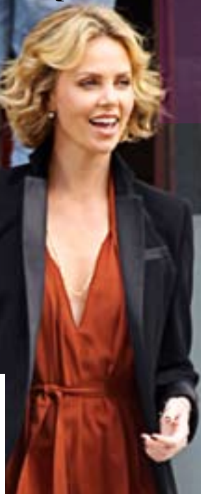
Charlize Theron, née le 7 août 1975.